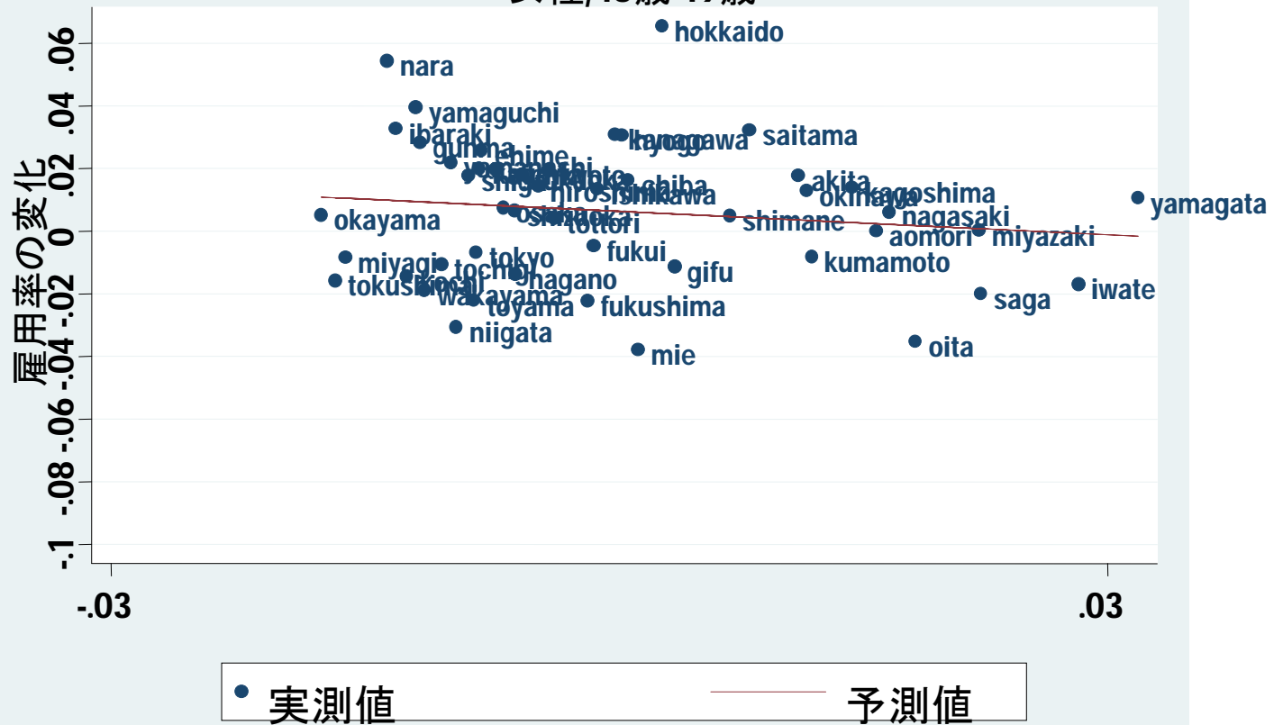
雇用率の変化と最低賃金影響率の関係 女性, 15歳-19歳